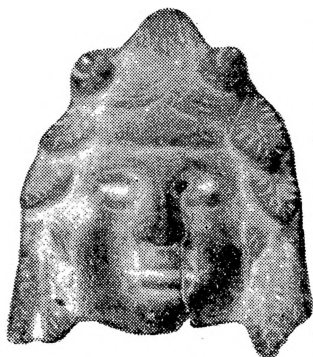
Сл. 1 — Бронзана апликација из околине Прахова. Fig. 1 — Application de bronze des environs de Prahovo.

Апликација је прилично добро очувана. Поред два мања пробоја на левој половини главе, већу озледу представља само вертикална напрслина која се спушта од левог ока наниже,